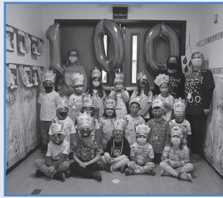
Students at Summit Lane Elementary School celebrated the 100th Day of School.