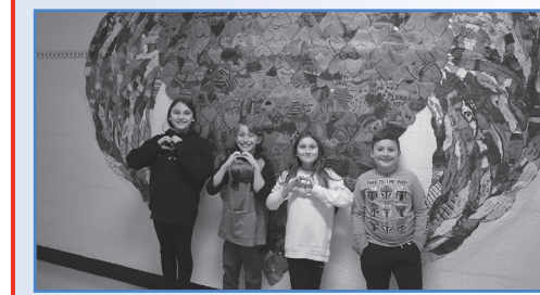
Students at Gardiners Avenue Elementary School shared messages of positivity.

Upon receipt, your application will be reviewed, pursuant to the provisions of the education law, to establish your entitlement to vote by absentee ballot. A ballot will then be issued to you. For more information, contact the district clerk at 516-434-7002.